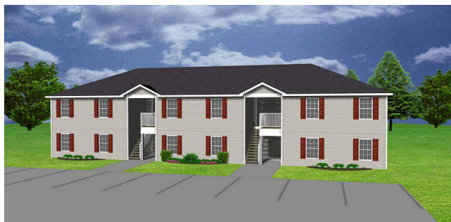
Mfano wa Nyumba ya Ghorofa moja ya wapangaji 6

Kujenga nyumba 12 kwenye eneo moja (Estate houses) yaweza kuonekana kuwa ni ngumu kwa wengi. Lakini kama mtu akijipangia kujenga nyumba hizo na akajenga nyumba moja moja, ndani ya miaka 10 anaweza kuzimaliza nyumba hizo. Aidha, taasisi za fedha kama benki na mifuko ya hifadhi ya jamii zinaweza kutoa mikopo kwa mtu ambaye anahitaji mikopo na anamiliki eneo lake kisheria. Kama eneo lako la ekari moja unalimiliki kisheria yaani una HATI ya kumiliki eneo lako, taasisi za fedha zinaweza kukupa mkopo unaoutaka. Chukua hatua sasa hivi. Changamka haraka.