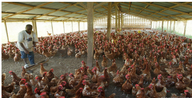
Mfano wa Banda la Kuku wa kienyeji

wa kujipatia mayai yasiyopungua 4500 kwa siku. Kama umejipanga vyema kuyauza mayai hayo kila siku kwa bei ya shilingi mia mbili tu kwa kila yai (Tshs 200) utakuwa na uwezo wa kukusanya pesa ipatayo Tshs 900,000 kwa siku. Kwa mwezi ukipiga hesabu utakuta unakusanya si chini ya Tshs 27,000,000.